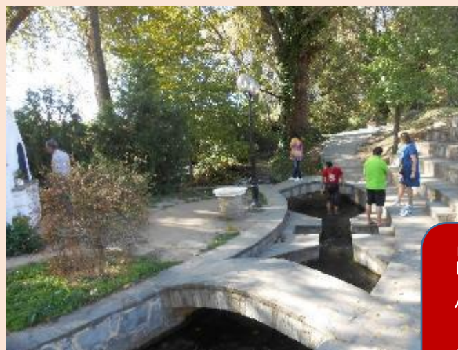
呂底亞受洗的小河，今仍有人在這裏受洗