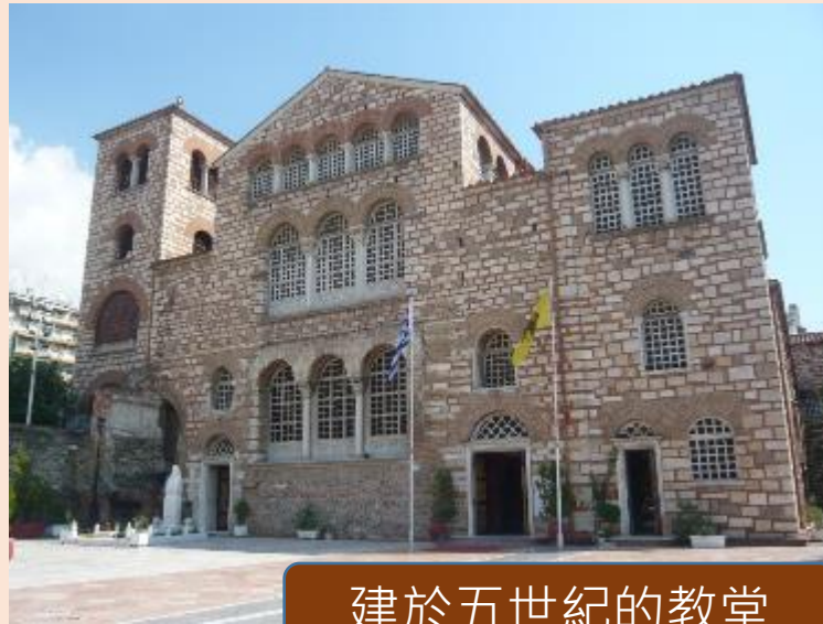
建於五世紀的教堂