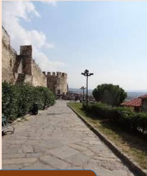
山上古城堡， 遠望見愛琴海